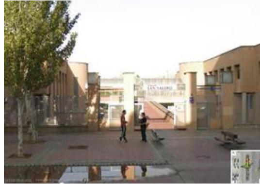
Entrada Fundación San Valero

Para las prácticas realizadas en c/ Violeta Parra 9 Centro San Valero, el acceso a las instalaciones se realizará por la entrada del edificio de Centro San Valero, no por la entrada del edificio de SEAS.