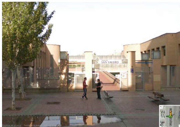
Entrada Fundación San Valero

Si alguien necesita entrar en otro momento y la puerta se encuentra cerrada, puede ponerse en contacto con el conserje llamando al móvil 606 431 974 .